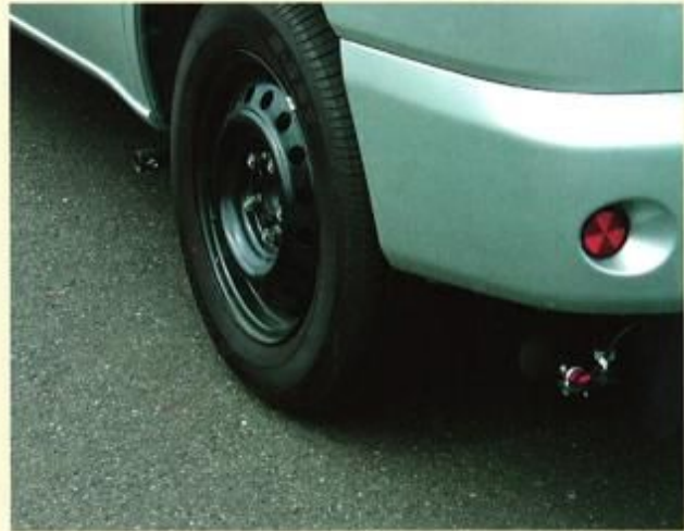
近接音法用測定マイクによる騒音測定