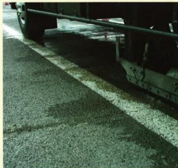
機能回復処理後の路面