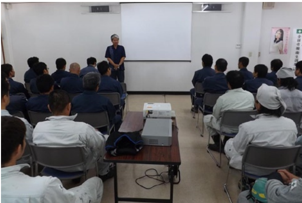
写真4 ビデオ学習会の様子