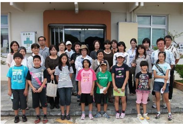
写真5 正面玄関前で記念写真撮影をする見学者の皆さん