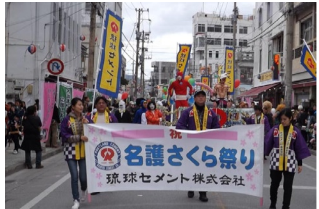
写真6 「名護さくら祭り・パレード」に参加