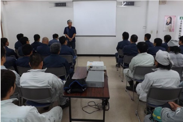
写真4 ビデオ学習会の様子