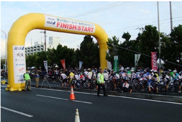
写真8 「ツール・ド・おきなわ」スタート直前の様子

地元名護市を中心地として開催される『ツール・ド・おきなわ(自転車ロードレース大会)』や、沖縄県離島の宮古島で開催される『全日本トライアスロン宮古島大会』なども地元企業として協賛し、大会を盛り上げています(写真8)。