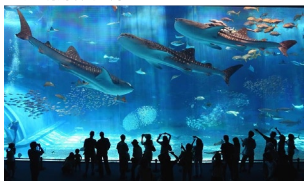
写真2 海洋博公園・沖縄美ら海水族館