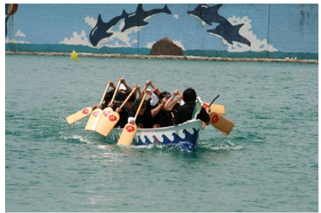
写真7 「名護市長杯争奪全島ハーリー大会」に参加