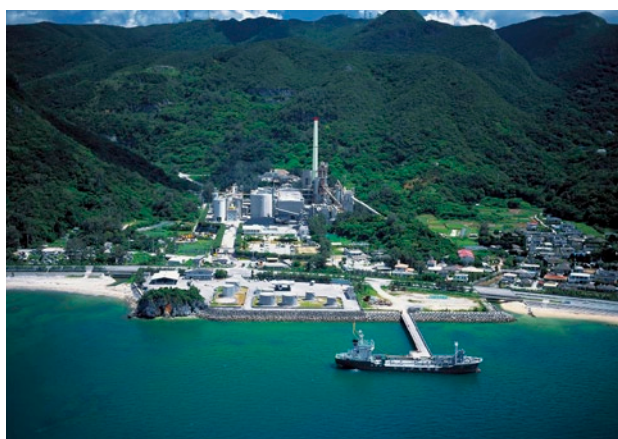
写真1 屋部工場全景とセメントタンカー船「琉仁丸」

安和鉱山での鉱産品目はセメント向け原料、港湾工食用捨石・被覆石、砕石・砕砂、および外販用原石があります。このうちセメント向け原料の割合は約30%で、粘土・砂味分を多く含む原石や砕石・砕砂プラントのアンダー品なども使用しながら鉱山資源の有効活用に努めています。