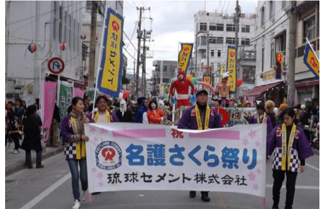
写真6 「名護さくら祭り・パレード」に参加