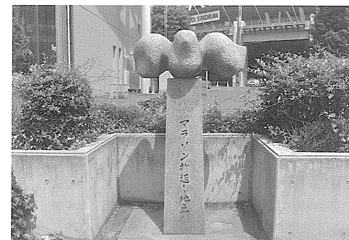
国道20号の調布市白糸台付近にある1964年東京五輪のマラソン折り返し地点の記念碑。約30年前まではこの周辺もコンクリート舗装であったようだ。